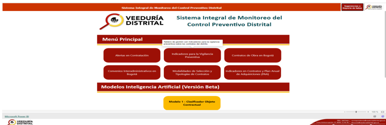
Figura 2. Diagrama de ventana de inicio