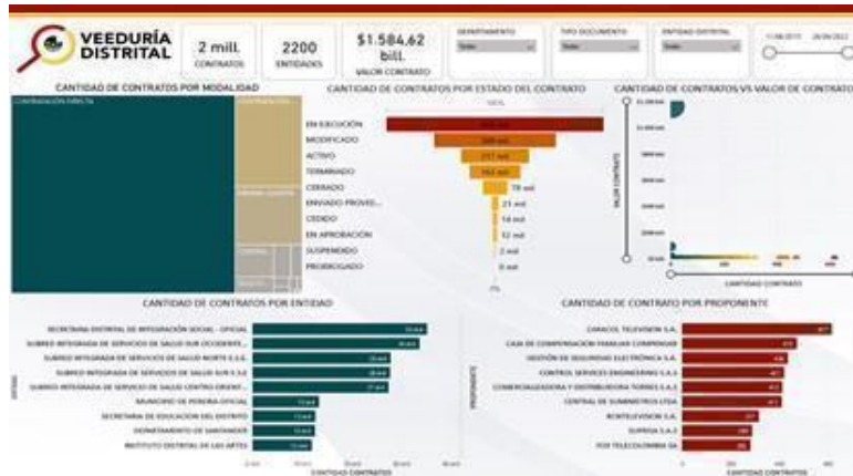
Figura 3. Diagrama de Gestión de información