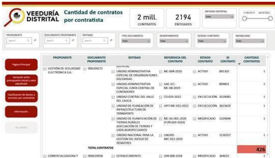
Figura 4. Diagrama de cantidad de contratos por contratista